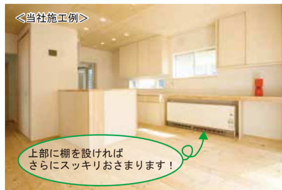
上部に棚を設ければさらにスッキリおさまります！