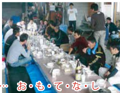
目頃の感謝の気持ちを込めて... お・も・て・な・し